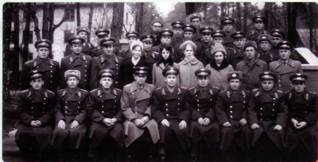
Кафедра "Наземное оборудование РК", 1968 год

установок и наземного механического оборудования". Кафедра №11 получила название "Конструкции пусковых установок и ракет".