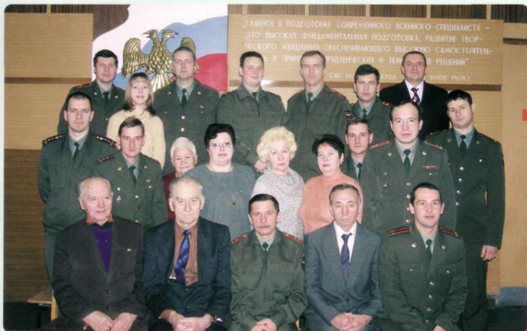
Кафедра "Конструкции пусковых установок и ракет", 2005 год