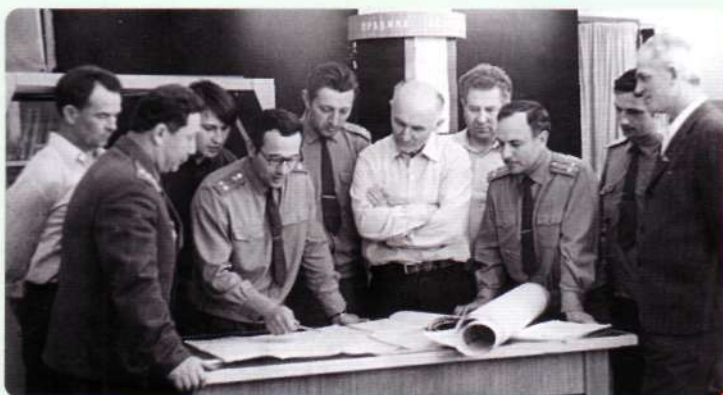
Сотрудники НИЛ-1, 1977 год