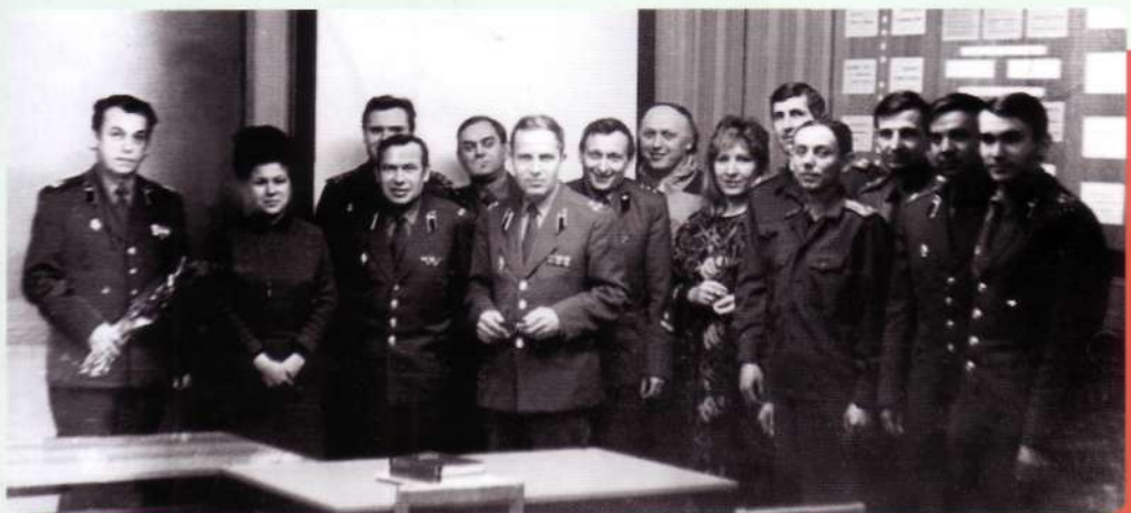
Кафедра "Наземное оборудование РК", 1990 год

Особенностями учебно-воспитательного процесса является постоянное стремление преподавательского состава к повышению своего профессионального уровня; качественное методическое и материальное обеспечение, компьютеризация занятий; тесная связь тематики курсового и дипломного проектирования с проблемами совершенствования ракетной техники и учебного процесса кафедры; фундаментальное изучение вопросов конструкции, условий и режимов эксплуатации вооружений; передача опыта и традиций кафедры молодым преподавателям.